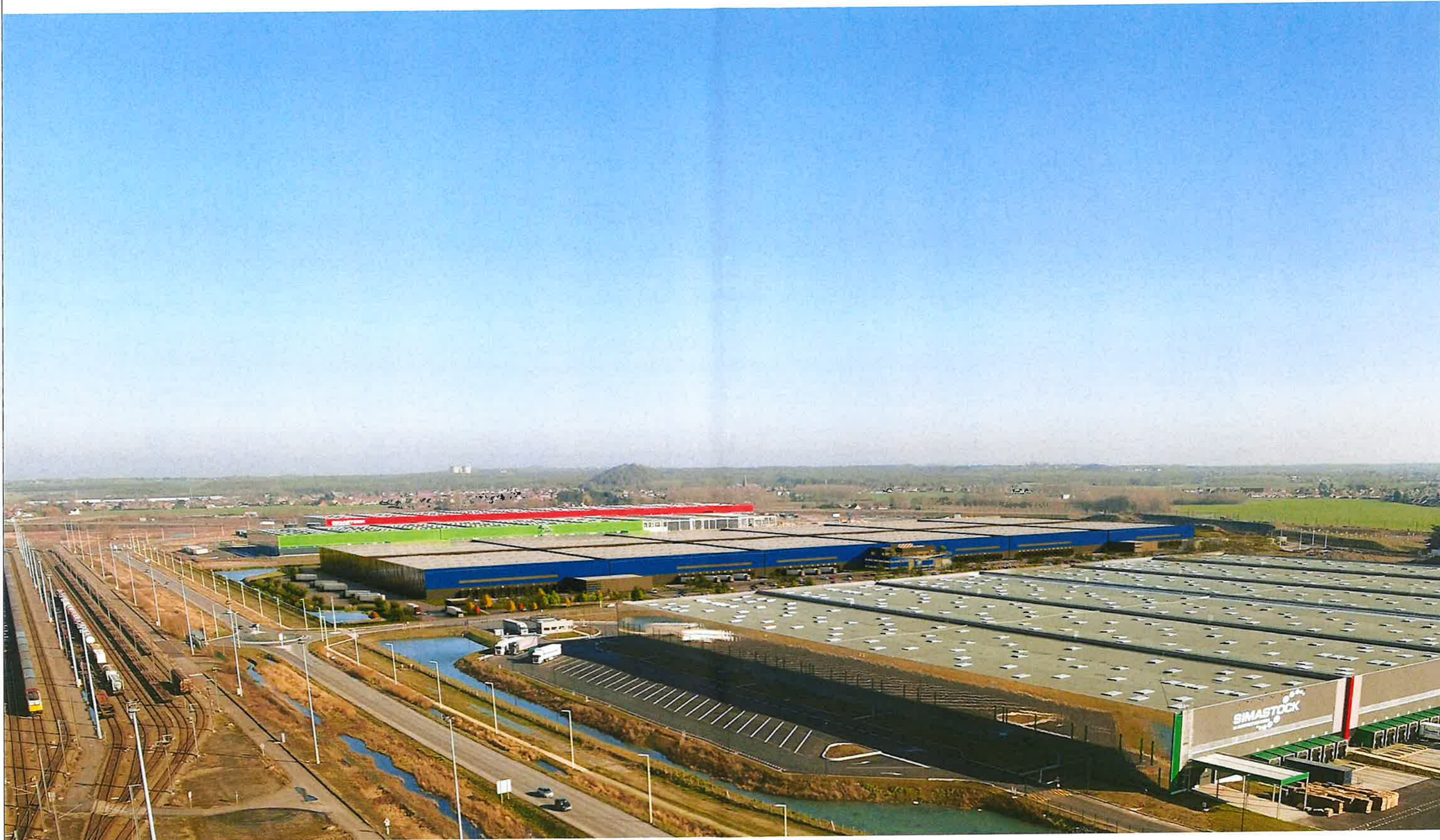
Insertion n° 1 : Vue aérienne