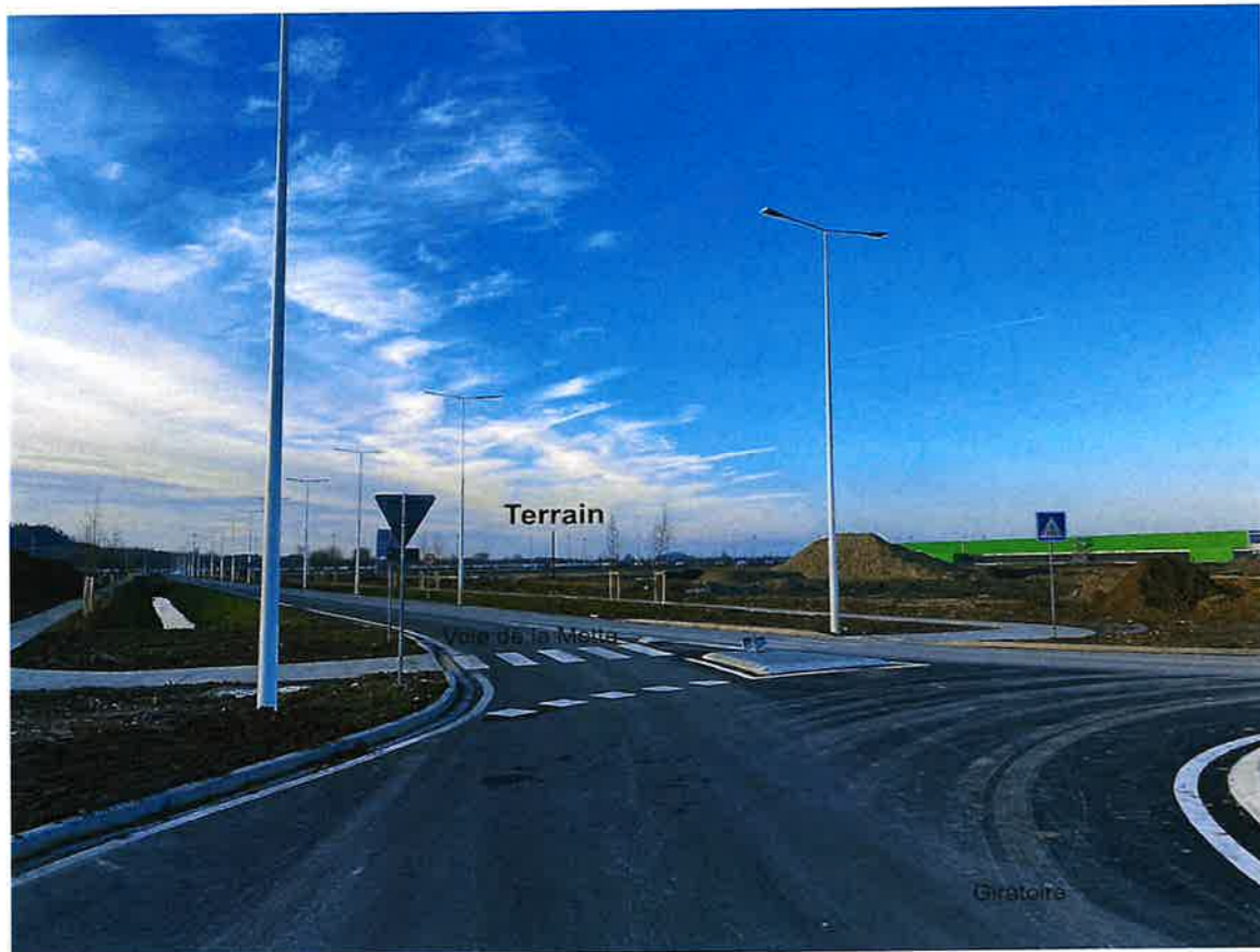
Vue 01 Depuis Voie de la Motte