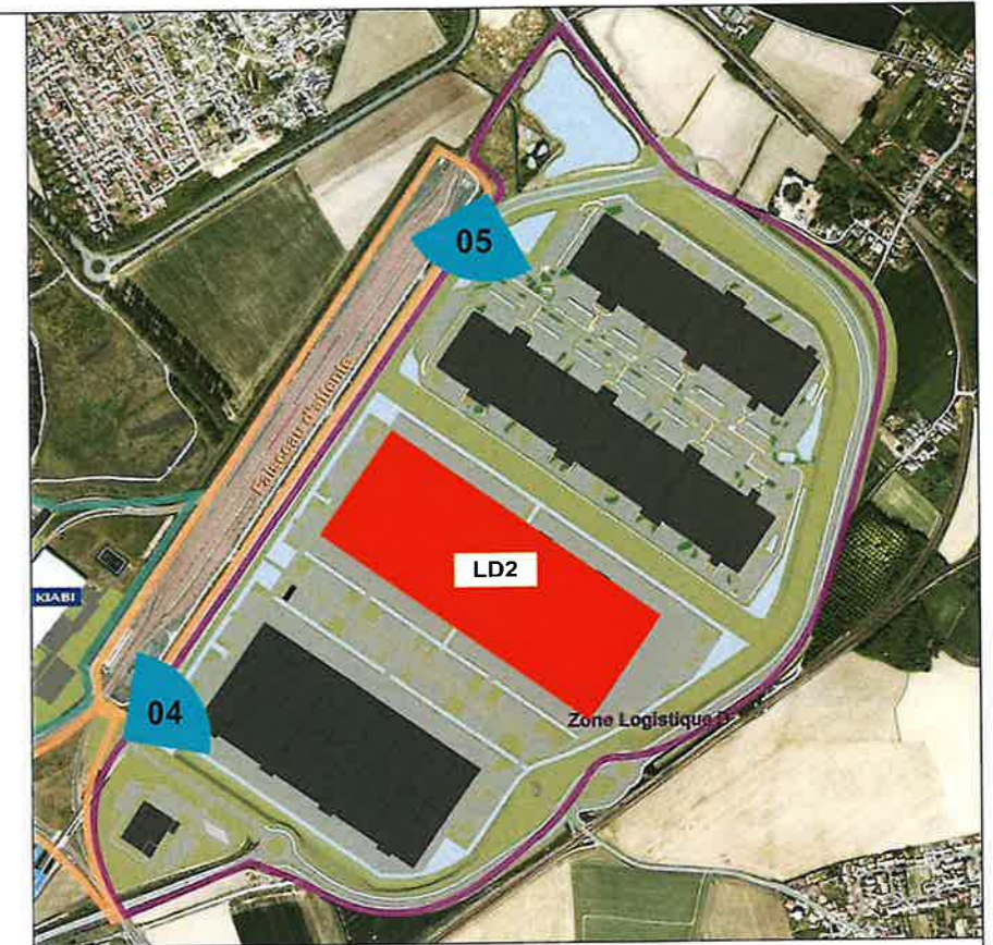
Vue 05 Depuis Allée des Bosquets