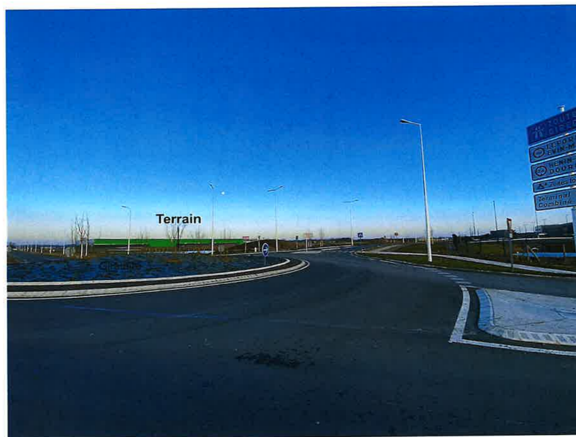
Vue 02 Depuis Allée des Bosquets